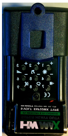
Bagside under pladen

Systemet klargøres: Ledning til display sættes i stikkontakt, og batteriet monteres i fjernbetjeningen.